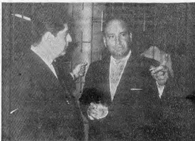
Un aparte durante la demostración del bus modelo "Dodge Superior" y agasajo a los transportistas, en los locales de "Costa Rica Machinery Company", en la Autopista El Coco. Conversan cordialmente sobre las excelencias del vehículo, don