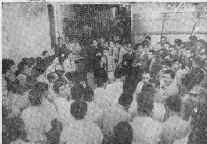
SEMANA DE SALUD MENTAL. — En la Penitenciaría Central un grupo de estudiantes del Liceo Costa Rica, que están llevando a cabo una efectiva labor social con los reclusos de ese centro penal. En la gráfica aparecen, los estudiantes:

El Presidente del Consejo Superior de Educación manifestó estar muy agradecido por la buena comprensión que encontró en el seno del Consejo ante las reformas planteadas, dentro de las estructuras de la segunda enseñanza y que fueron aprobadas.